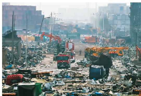
救援人员使用工程机械清除障碍。

目前，负责产业园运营的泰达科技集团立即启动损害一级应急预案，切断楼宇内部水、电、气等，确认园区企业受灾及人员受伤情况，协调解决企业困难。同时第一时间向保险公司报险，目前已经获得200万元预付赔款，支持园区恢复。