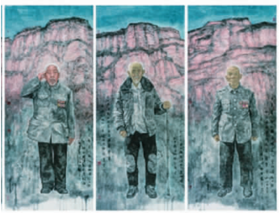
卫国者荣——为抗日老兵塑像（局部） 范墨

国家博物馆副馆长陈履生表示，美术作品与生活的关系不能因是否处在不同时代就有所疏离。毋庸置疑，抗战历史题材的创作仍然具有启示当下和平生活的重要意义。