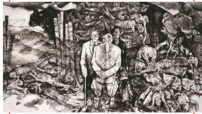
同胞、汉奸和狗——矿工图之五 周思聪 卢沉