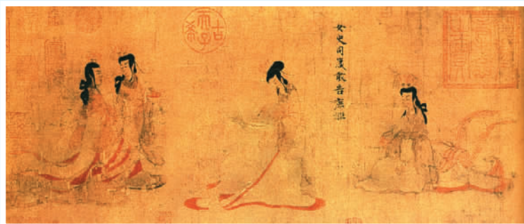
女史箴图（局部） 东晋 顾恺之

像古代的典籍一样，这样长的手卷作品，也是从右到左展开。阅看时只能逐渐打开，看完一段之后卷上，再看下一段的。因此，人们每次只能看到一个劝诫的故事。这种方式有点像连环画。但与连环画不同的是，这9个故事并没有