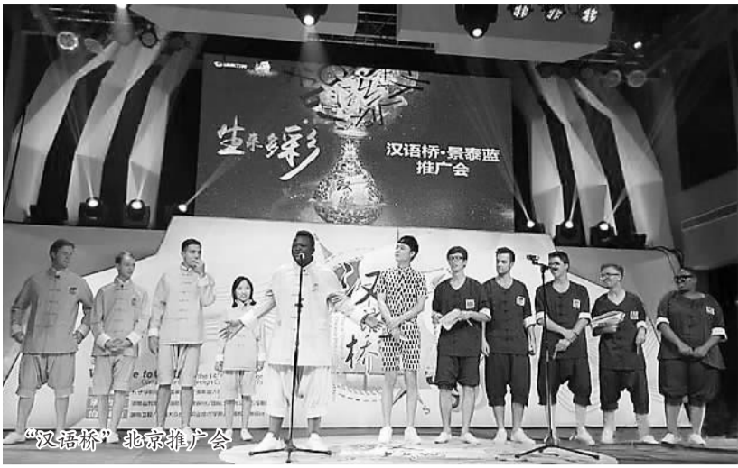
“汉语桥”北京推广会