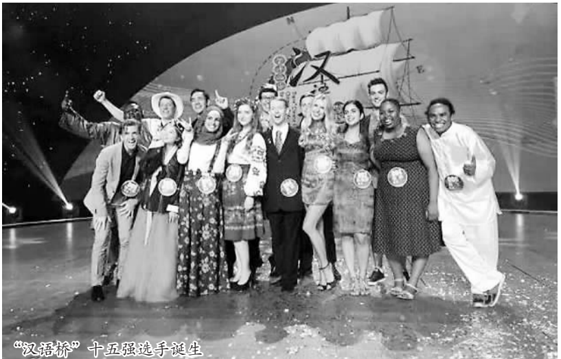
“汉语桥”十五强选手诞生