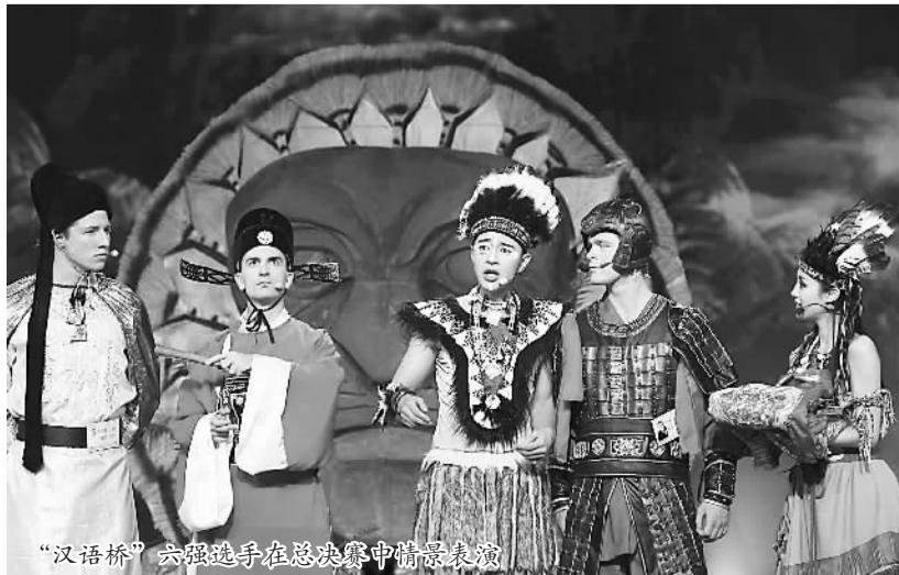
“汉语桥”六强选手在总决赛中情景表演