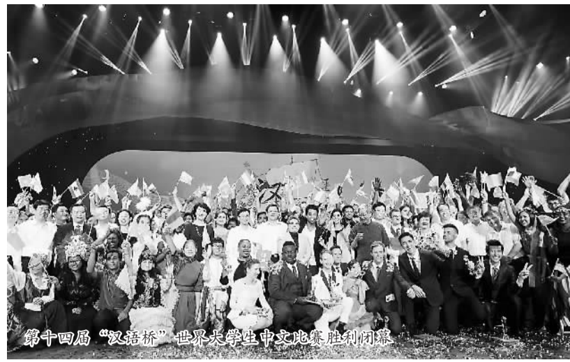
第十四届“汉语桥”世界大学生中文比赛总决赛颁奖