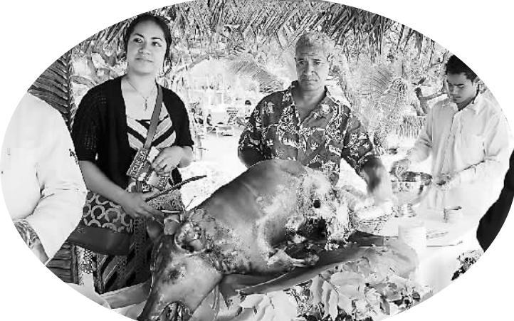
汤加美食棕榈叶托烤全猪

中国驻悉尼旅游办事处主任罗卫建说，中汤《关于旅游合作的谅解备忘录》包含了2015年至2020年两国在数据交换与信息交流、市场推广、业界合作、人才培养、国际组织框架下合作等五个领域的合作目标和计划。两国旅游业界对于2015年千人游汤加计划表现出很高的积极性，汤加作为南太平洋的旅游目的地，其纯天然、无污染、原生态等特点将对中国游客产生巨大的吸引力。