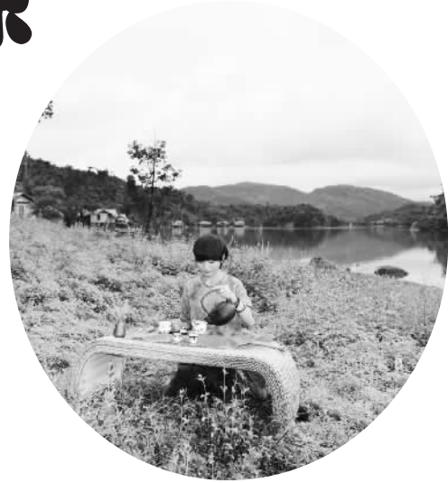
游客在神玉书院品茶