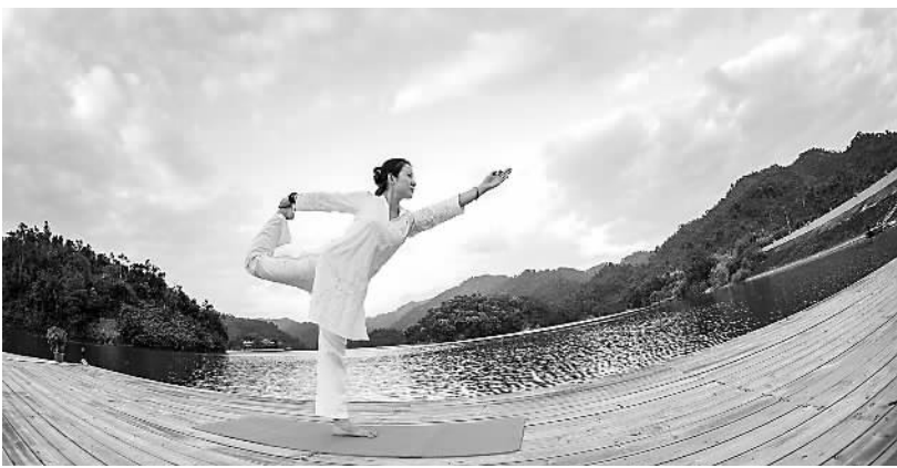
游客在五指山南麓的神玉书院练瑜伽