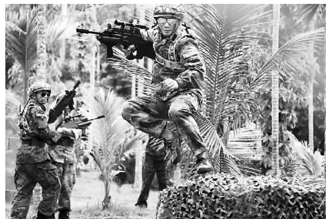
游客在呀诺达体验雨林真人CS拓展项目

海南冬泡温泉早已远近闻名，而冷泉则鲜为人知。在炎热的夏天，倘若能泡在凉爽的冷泉之中，是何等的惬意。