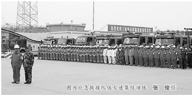
图为应急救援队伍火速集结演练

穆铁礼甫·哈斯木在对演练点评时强调，演练体现了中国石化驻疆企业的社会责任意识和勇于担当的意识。他要求要以演练为契机，进一步提升自治区应急处置能力，为自治区全面深化改革提供安全稳定的社会环境。