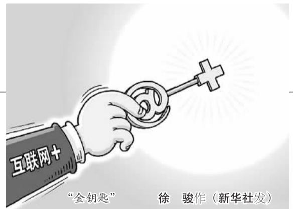
“金钥匙” 徐骏作

“互联网+”时代的到来,在为传统行业带来变革的同时,也催生了大批以“互联网+”模式为创业项目依托的新兴企业。众多海归将其掌握的先进的互联网技术和理念融入到创业过程中,取得了良好的发展。