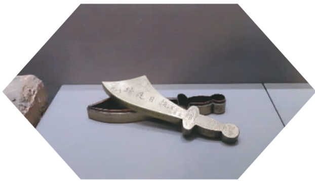
图为展览展出的冯玉祥送给第29军军长宋哲元的大刀形铜墨盒。

从“九一八事变”声援东北同胞到“一二九运动”掀起抗日救亡运动的高潮，从长城抗战发出民族危亡的最强音到卢沟桥事变掀开全民族抗战的大幕，当时的北京人民始终站在抗日救亡运动的最前线。