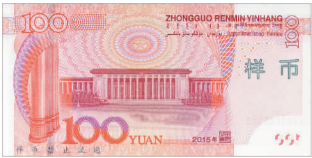
即将发行的新版100元纸币样币。

中国人民银行8月10日在其官网发布公告称,中国人民银行将定于今年11月12日起发行2015年版第五套人民币100元纸币。2015年版第五套人民币100元纸币在保持2005年版第五套人民币100元纸币的主图案、主色调等不变的前提下,对部分图案做了适当调整,对整体防伪性能进行了提升。