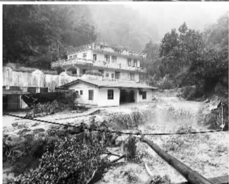
8月8日,新北市三峡多处溪水暴涨,泥石流流进一处民宅。