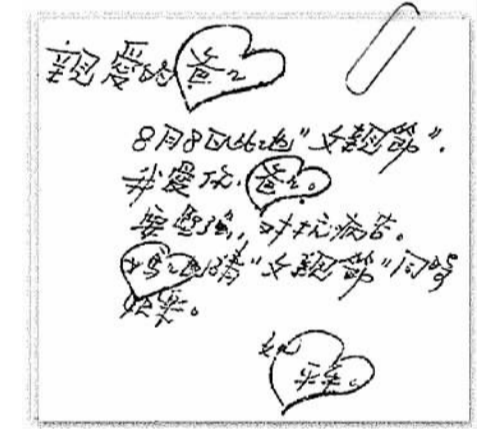
▲台湾作家三毛的父亲节贺卡。