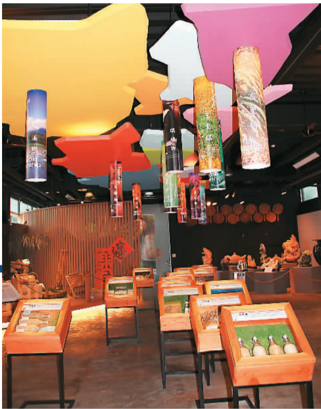
农产品展示中心设计精心、占地不小，只是观者寥寥，成为形象工程。