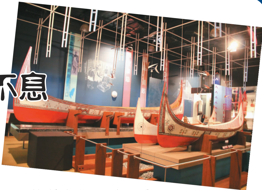
台湾各县市有不少规模与当地人口不相称的大型博物馆，可惜展品不错却少人参观。

花莲市的“阳光电城”是台湾实践太阳光电的示范工程，建设时有“非核家园”、“绿色旅游新景点”的目标，但花莲空气中盐分高，光电板易氧化，发电量远不如预期，电费收入18万元，电城维护管理费却上百万元。至于景点，刚开始有人觉得新鲜进来看看，但发电也没什么好看的，很快就无人光顾，阳光城变成黑暗城，不少流浪汉在此落脚，还有人剪了电缆换酒喝。花莲市也很无奈：“上面只给了建的钱，没给管的钱，也没教我们该怎么管。”