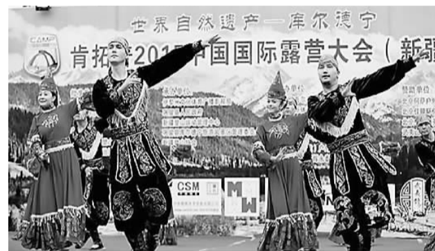
露营现场，新疆群众载歌载舞，带来精彩的表演。

从地形上看，巩留像一只彩蝶在伊犁河谷中翩翩起舞。东翼是山清水秀、风景秀美的林海草原；西翼则是阡陌纵横、麦熟稻香的河谷平原。这里是“生态天堂”、“九水之源”、“雪岭云杉的故乡”，更是“天山最美的绿谷”、“塞外民俗文化