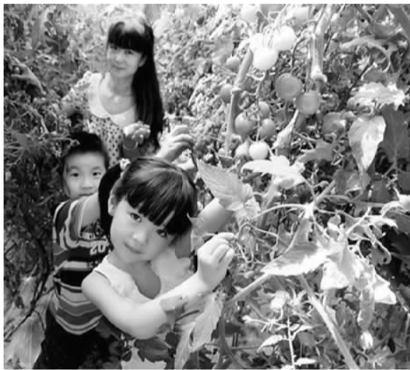
游客在红星一场采摘园里享受采摘的乐趣。

近年来，新疆生产建设兵团第十三师不断开发师域旅游资源，推进旅游产业朝农旅融合、体旅融合、文旅融合、商旅融合的方向发展。