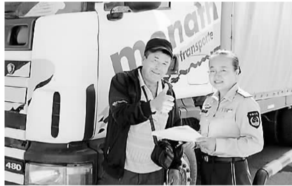
哈萨克斯坦司机向霍尔果斯边检站执勤官兵点赞。

如今，霍尔果斯边检站已成为祖国西部展示国家文明形象的重要窗口、连接中亚人民友谊的绿色纽带、维护新疆安全稳定的有效屏障。全站官兵将用真诚、真心、真意在古丝绸之路上演绎着中华文明使者的全新内涵。