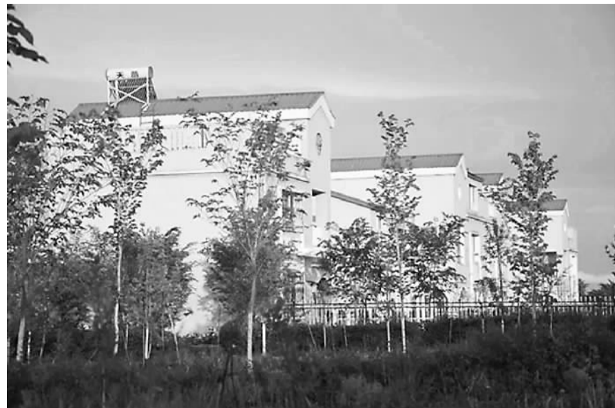
烽火台小镇农家院

截至目前，西山农牧场共兴建157栋居民住房，完成天然气入户工程，团场文化活动中心、社区、物业等配套服务设施一应俱全。