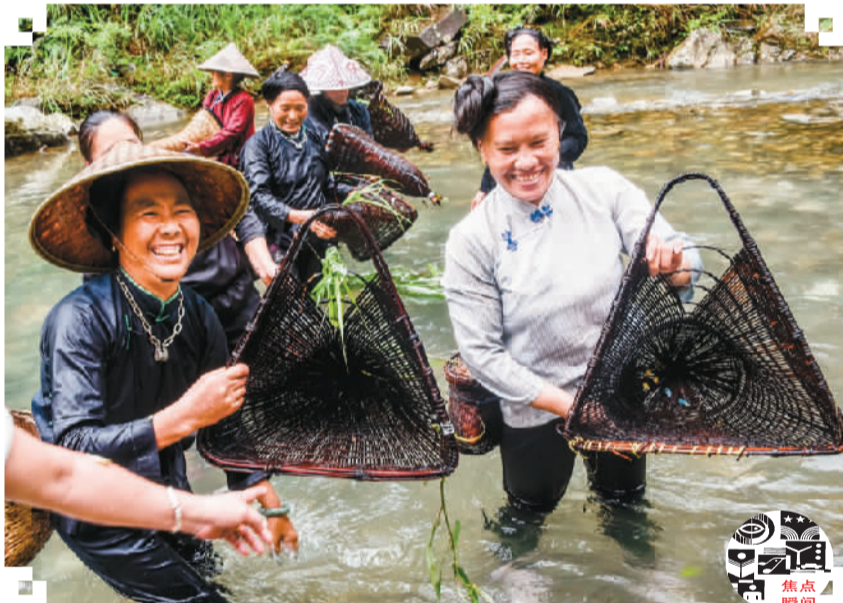
7月28日(农历六月十三),贵州省从江县加榜乡下尧村壮族群众举行一年一度的嬉水节。