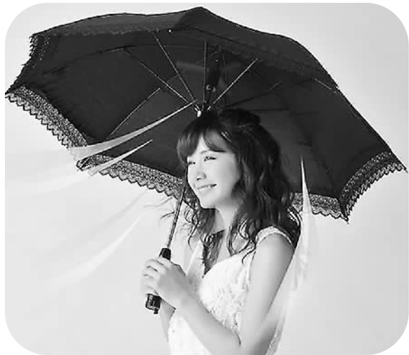
图为带风扇的晴雨两用伞。

当然,避暑“神器”还有很多,相信向前发展的科学技术与永不停歇的创新精神能够帮助人类夏日无忧。