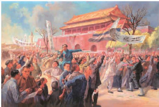
1951年《五四运动》（国家博物馆藏）周令钊

如今，96岁高龄的周令钊仍然笔耕不辍。他是时代的歌者、艺术家的楷模。愿老先生身体健康，艺术之树常青！