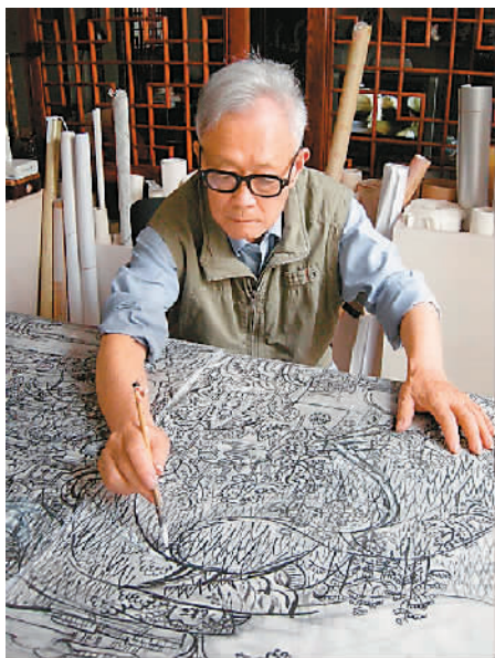
2011年6月作驻京湖南大厦壁画《长沙》草图

今年是世界反法西斯战争、中国人民抗日战争胜利70周年。作为历史的参与者和见证者，美术家周令钊先生当年参加抗战文艺宣传，后来又多次参与重大题材美术创作。从周先生的笔下，我们可以聆听时代回响，纪念峥嵘岁月。