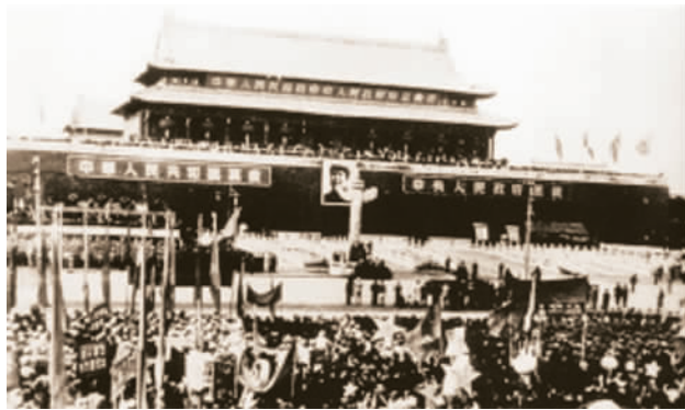
天安门城楼第一张毛主席像

天安门城楼中间门洞约8米高，主席的画像就悬挂在上面，涂改巨幅画像上的几个字谈何容易。“当时设备非常简陋，没有升降机。”在三个直梯绑成的巨型长梯上，所有聚光灯打向城楼，周令钊一手拿照片、调色板，一手握画笔，再一次爬到了巨幅画像前。梯子挪动十几次，上上下下几十次。涂改了文字，添加了衣扣，收工时天已大亮，此时距开国大典就剩