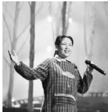
▲农民歌手在舞台上

《中国农民歌会》源于文化部、农业部和安徽省人民政府联合主办的文化艺术盛会——“中国农民歌会”,在农村改革发源地安徽省滁州市已成功唱响4届。据安徽广播电视台党委书记庄保斌介绍,之所以研发这档节目,是考虑到8亿农民在电视表达中始终处于边缘,一直没有一个平台真正让农民唱歌。而在城市化的进程中,人们对于“乡土情怀”的抒发是有需求的,中国农民群体庞大的基数是节目的收视竞争力之所在。