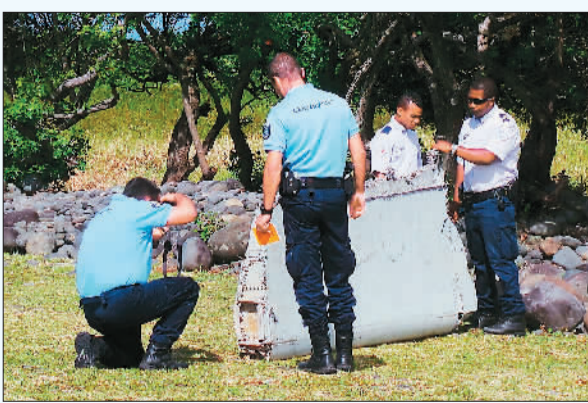
▲ 警察在查看一块飞机残骸。