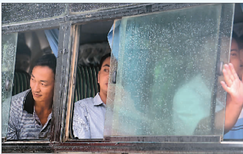
7月30日,缅甸总统吴登盛签署大赦令,立即释放6966名服刑者,其中包括日前被缅甸判刑的155名中国伐木工人。获释的中国伐木工人从大巴车上向外张望。密支那巴拉摄(新华社发)