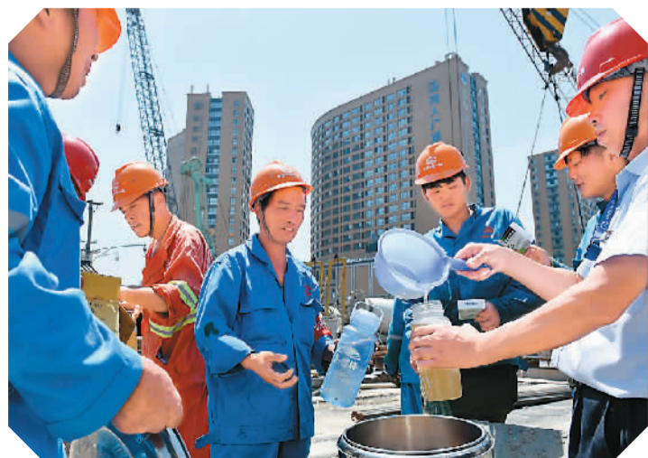
▲ 工作人员把绿豆汤送到杭州地铁二号线建设工人手中。

高山认为,虽然国家早已出台规定,但仍有一些企业单位老板受利益驱使,并没有按时向员工发放高温津贴,员工为了保住工作,只能忍气吞声。究其原因,还是制度不够完善。如果法律中能够有明确的处罚措施和管理部门,就会对那些企业形成约束力,使员工在受到利益侵害时有门可诉。