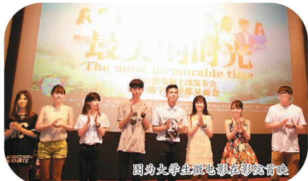
图为大学生微电影在影院首映

如果说10年前《超级女声》开启了一个电视“选秀”节目时代,那么3年前的《爸爸去哪儿》则又开启了一个“真人秀”节目时代。据不完全统计,2015年各大卫视在黄金时段播出了真人秀节目多达数十档,各种亲子类、竞技类、情感类“真人秀”让人眼花缭乱。