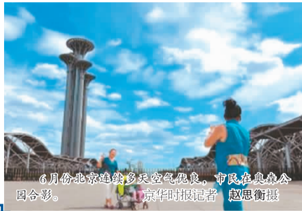
6月份北京连续多天空气优良,市民在奥林匹克公园合影。

庄志东表示,今后帮扶还将继续,虽然每年帮扶的资金数目不固定,但每年都会投入。今后,资金投入还会考虑到工业治理、机动车治理等大气治理的多个方面。