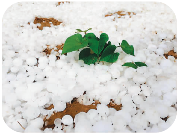
陕西榆林遭鸡蛋般大冰雹袭击，庄稼损失惨重。

全世界的侨胞心系老区，全世界的“侨力”涌向陕北。哪怕暴雨“倾城”，亦可化“侨”为舟。而通过“微”平台聚集在一起的各国侨胞联系更为紧密，将成为一股有生力量，推动祖籍国向前发展。