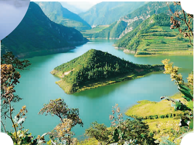
陕西黑河国家森林公园

上半年,全省旅游新建、在建项目340多个,完成投资240亿元,同比分别增长30.76%、33.33%。太白山水上乐园、大荔沙苑景区、留坝水世界乐园建成开放。乐华城项目对外开业,填补了西部没有大型娱乐体验项目的空白。旅游重点项目的投资和建设,有效推动了丝路旅游的加快发展和全省旅游业的提档升级。