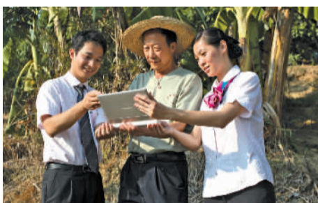
邮储银行信贷员利用移动设备现场进行业务受理。

1.34亿户，电子银行交易替代率接近70%，与此同时，其手机银行客户数近期屡创新高，目前已突破8000万户，整体客户规模、服务功能、系统安全等方面均处于同业领先水平。