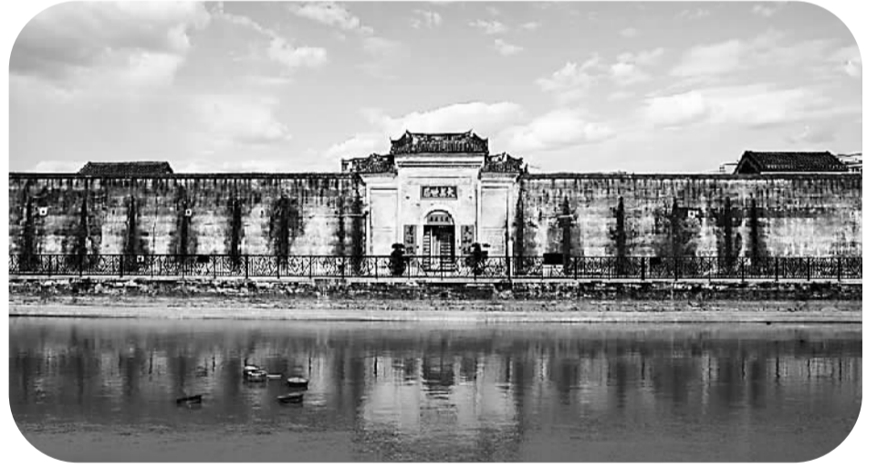
深圳坪山客家民居

6年来，新区充分依托东纵纪念馆这一红色基地，不断挖掘“东纵”历史文化内核，广泛开展“东纵”主题爱国主义教育，传承和发扬“东纵精神”，以东纵纵队影视剧为载体，多角度、多形式打造“东纵”文化品牌，