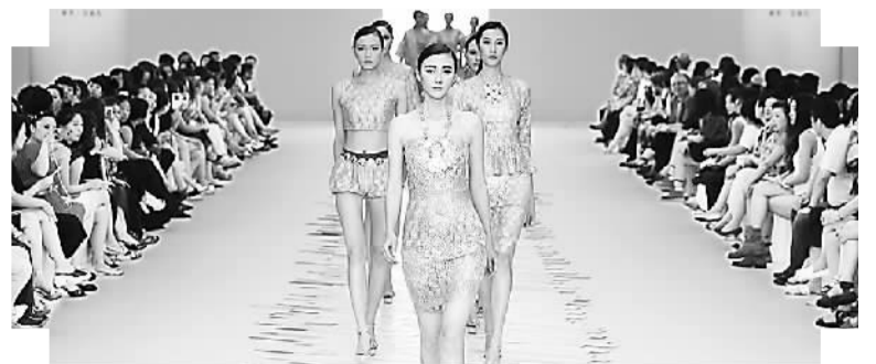
模特在服交会活动现场进行服装展示

态环保和智能化对时尚产业附加值的提升。此外，由IBM与深圳企大共同打造的“科技引领时尚”论坛、WGSN举办的“流行趋势讲座”以及“互联网+与资本运营”、“品质提高生活”等，就科技与时尚、商业模式创新、全渠道运营、流行趋势分析等话题，力邀专家学者、业界精英展开了深度探讨与交流，为服装行业在互联网时代的升级发展指明了方向。