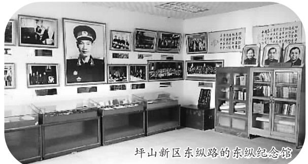
坪山新区东纵路的东纵纪念馆

新区把文化创意产业纳入新区的综合发展规划，制定了《坪山新区文化产业振兴发展规划》，出台了新区文化产业扶持政策；成立文化产业专项扶持资金，制定《坪山新区文化产业发展专项资金管理暂行办法》，进一