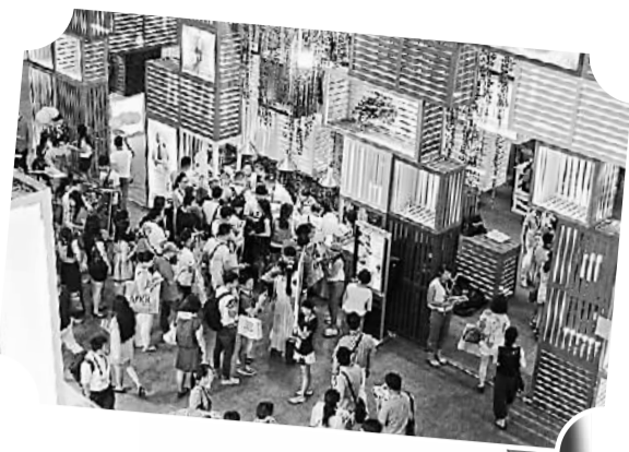
深圳服交会吸引了大批参观者

深圳服交会期间，主办方还举行了主题为“科技引领时尚——科技助推企业发展”的论坛活动，探讨生