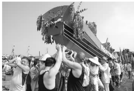
浙江台州大暑送“大暑船”