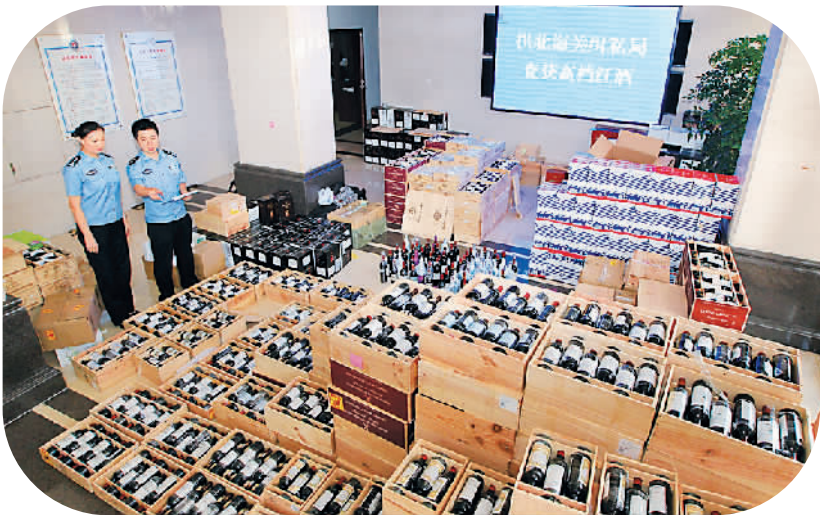
拱北海关近日摧毁6个涉嫌利用“水客”走私高档红酒的犯罪团伙，涉案总值约1.08亿元，查扣拉菲等高档品牌红酒共计4544瓶。目前16名犯罪嫌疑人悉数落网。图为缉私警察在清点涉案红酒。