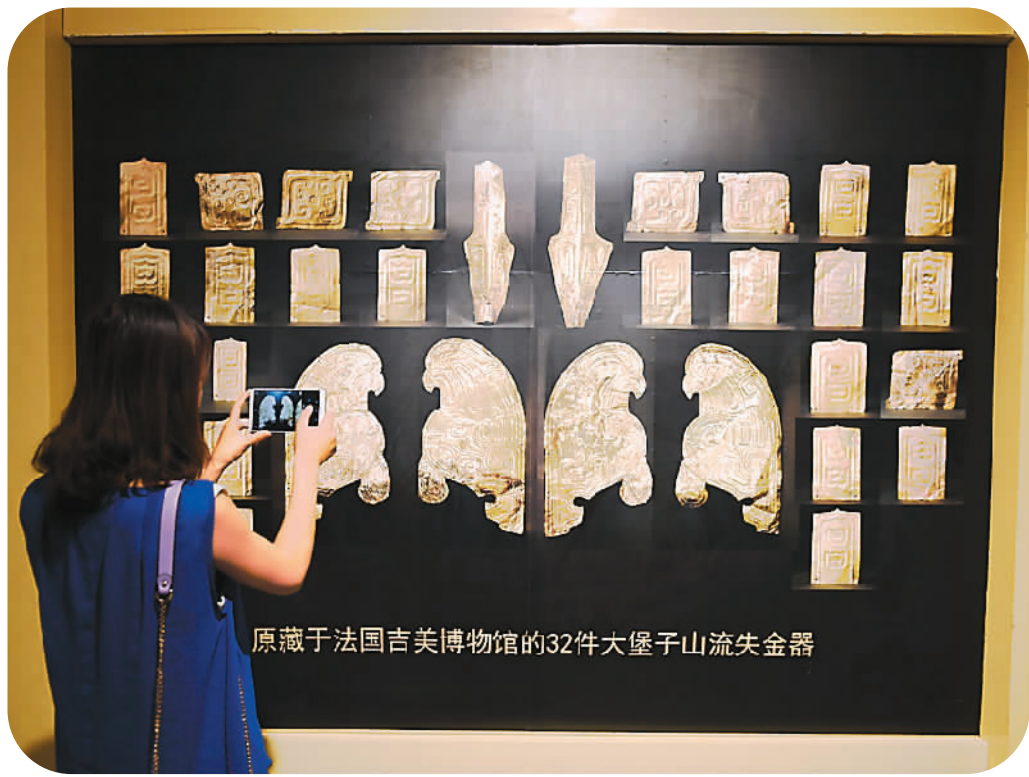
原藏于法国吉美博物馆的32件大堡子山流失金器