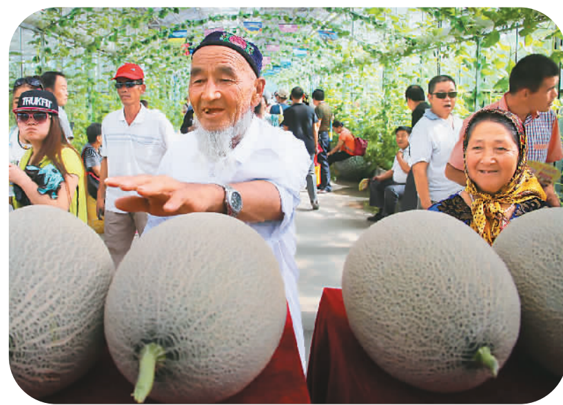
7月20日，“甜蜜之旅”第十二届哈密瓜节在新疆哈密瓜园开幕，共展出150余种精品有机哈密瓜，游客和市民可以免费品尝。