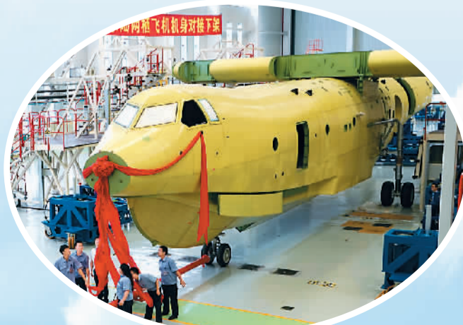
已完成机身对接的AG600被移至总装区域。

AG600飞机按照“水陆两栖、一机多型、系列发展”的设计思路,采用单船身、悬臂上单翼布局及前三点可收放式起落架,选装4台涡桨发动机,最大起飞重量53.5吨,20秒内可一次汲水12吨。具有执行森林灭火、水上救援等多项特种任务能力,可根据用户需要加装必要设备,满足执行海洋环境监测、资源探测、客货运输等任务的需要。这款飞机的最大特点是既能在陆地上起降,又能在水面上起降,可在水源与火场之间多次往返投水灭火,除水面低空搜索外,还可在水面停泊实施救援行动,水上应急救援一次可救护50名遇险人员。