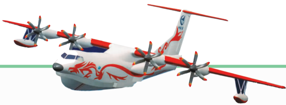
“蛟龙” AG600效果图。