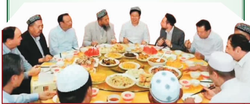
自治区官员与穆斯林群众共进开斋饭。

他说,宗教信仰自由是我国公民的基本权利,多年来,在新疆这片土地上,信仰伊斯兰教的群众、信仰其他宗教的群众、不信仰宗教的群众和睦相处,一起维护和平、团结、正义、尊严,一道建设美好家园。今年斋月期间,新疆宗教活动正常进行,广大穆斯林群众享受到充分的宗教信仰自由,大家彼此关爱,铭记对社会和他人的义务,一起帮助不幸的人,传递着社会正能量,希望这种精神一直延续下去。