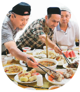
共进斋饭