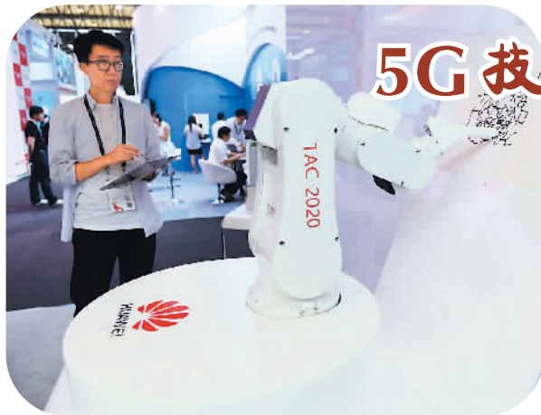
上图:机器人画家产品。它可以通过5G遥控技术,把画师的一笔一画实时传输给机械手,实现快速作画。

据新华社北京7月17日电(记者李延霞、刘铮)人民银行17日公布的数据显示,截至2015年6月底,我国黄金储备规模为5332万盎司,折合1658吨,较2009年4月底以来的规模增加了604吨。有关负责人表示,黄金具有金融和商品的多重属性,与其他资产一起,有助于调节和优化国际储备组合的整体风险收益特性。