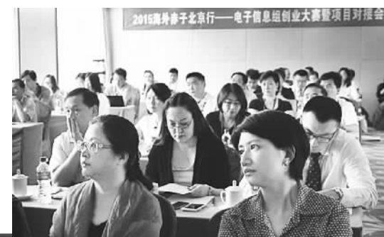
在创业大赛暨创业项目对接会上，留创园和投资机构代表现场仔细观察选手项目展示。

和风险投资公司代表在点评阶段可向项目展示人提问，对有意向联系的项目展示人可递交邀约卡。比赛现场，有的选手现场收到许多投资人递来的邀约卡和名片，有的什么都没有收到。