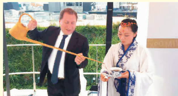
意大利驻重庆总领事馆总领事马非同(左一)在现场学习茶艺

一定要去观看。我今年将大学毕业，我的毕业论文就是‘成都与茶馆’，今后肯定还会再去成都。”那位在开幕式上演唱《太阳出来喜洋洋》的卢卡·马乔尼(Luca maggioni)虽然多次到成都学习、观光，但仍然不忘对成都的思念。成都的国际化之路也正是在这些“国际使者”的脚下越走越开阔。