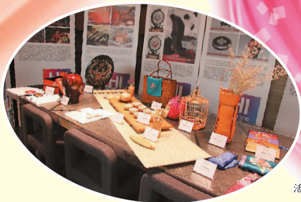
活动现场的“非遗”实物展示