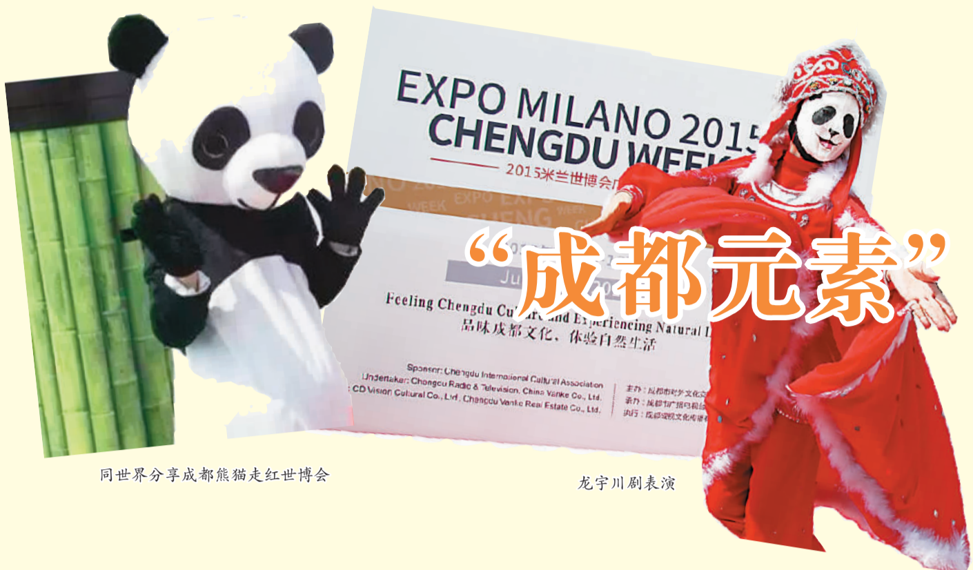
同世界分享成都熊猫走红世博会