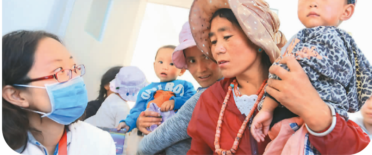
“共铸中国心阿坝行”的医务工作者和志愿者日前走进四川省阿坝藏族羌族自治州若尔盖县冻列乡开展义诊。筛查确诊的3例先心病患者将由“共铸中国心基金会”出资到北京免费治疗。图为北京儿童医院专家与患儿家长交谈。