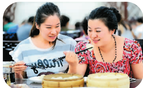
▲沈阳顾客在品尝“头伏饺子”。

根据相关规定,当日气温达到40℃以上时,相关单位应停止员工室外露天作业,且用人单位不得扣除或降低工资;当劳动者在35℃以上高温天气从事室外露天作业以及不能采取有效措施将工作场所温度降低到33℃以下的,应当向劳动者发放高温津贴。如用人单位违规,劳动者可以向劳动监察部门维权。