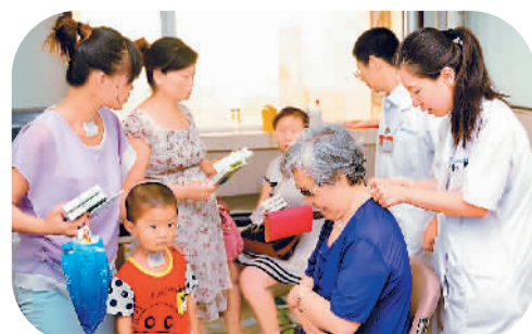
▲河北省沧州市民在医院贴“三伏贴”。