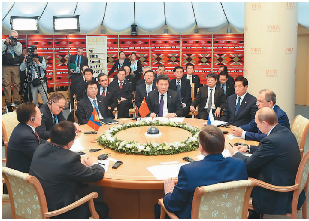
▲ 习近平同俄罗斯总统普京、蒙古国总统额勒贝格道尔吉举行中俄蒙元首第二次会晤。