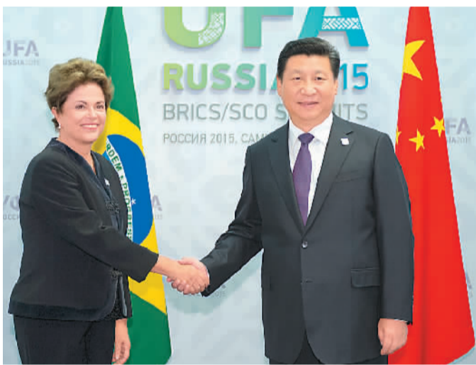
▲ 习近平会见巴西总统罗塞夫。

祖马表示,赞同习近平主席对中南关系的积极评价,中南关系建立在高度互信的基础之上。去年我访华期间,同习主席就深化中南关系达成重要共识。根据双方确定的合作规划,两国海洋经济、金融、农业、旅游、科技、能源等重点领域的合作正顺利开展。南中在多边事务中也保持着有效协调。金砖国家发展势头不可阻挡。南非赞同金砖国家加强合作,以增强新兴市场国家和发展中国家维护共同权益的能力。