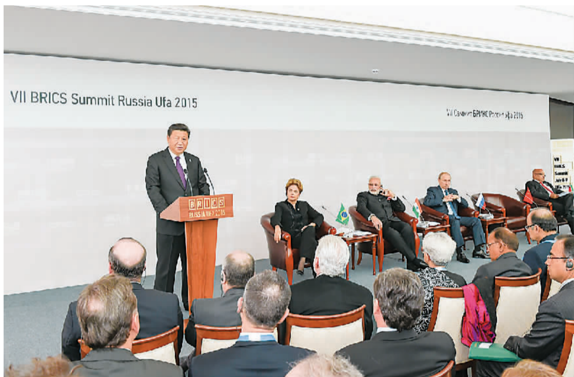
▲ 习近平同俄罗斯总统普京、巴西总统罗塞夫、印度总理莫迪、南非总统祖马一起出席对话会。