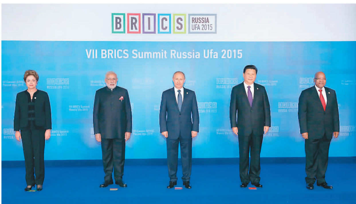
7月9日,金砖国家领导人第七次会晤在俄罗斯乌法举行。中国国家主席习近平、俄罗斯总统普京、巴西总统罗塞夫、印度总理莫迪、南非总统祖马出席。图为金砖国家领导人集体合影。

本报俄罗斯乌法7月9日电(记者杜尚泽、林雪丹)7月9日,金砖国家领导人第七次会晤在俄罗斯乌法举行。中国国家主席习近平、俄罗斯总统普京、巴西总统罗塞夫、印度总理莫迪、南非总统祖马出席。5国领导人围绕“金砖国家伙伴关系”主题,就当前国际形势和金砖国家合作交换看法,达成广泛共识,取得丰硕成果。