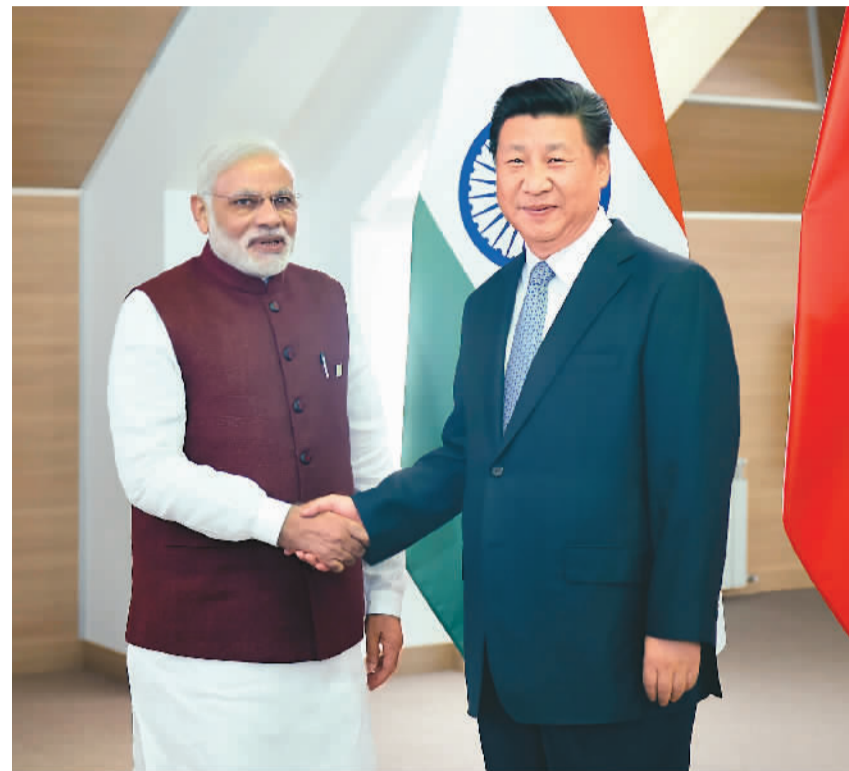
七月八日, 国家主席习近平在俄罗斯乌法会见印度总理莫迪。