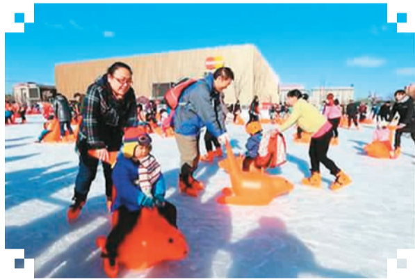
图为游客体验五棵松冰世界体育乐园。

什么是奥林匹克精神?《奥林匹克宪章》指出,奥林匹克精神就是相互了解、友谊、团结和公平竞争的精神。它包括了参与原则、竞争原则、公正原则、友谊原则和奋斗原则。遍览其中,“参与原则”赫然列在第一位。