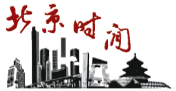
人民日报海外版 联合主办 北京市人民政府新闻办公室

只有与奥运理念真正契合的城市,才能真正最大限度地传播奥林匹克精神。而将自身发展与申办奥运完美融合的北京,无疑正期待着与奥林匹克再次相拥。