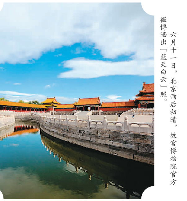
六月十一日,北京雨后初晴,故宫博物院官方微博晒出一蓝天白云日照。