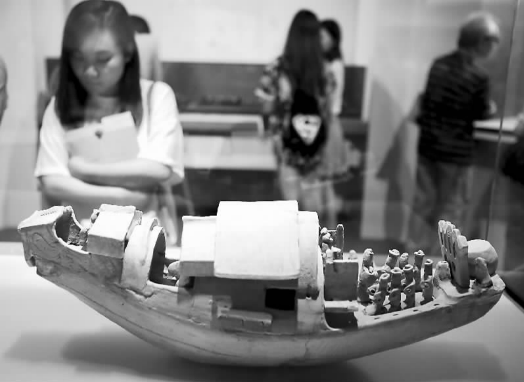
大型汉代文物展“汉武盛世：帝国的巩固和对外交流”自上月底开幕以来，受到香港市民的热捧，已有万余人前来参观。展览分“汉帝国的巩固和扩张”、“汉代社会生活”和“汉代的科技、文化与中西交通”3个主题，展出逾160组珍贵文物。图为观众在参观附设俑红陶船。