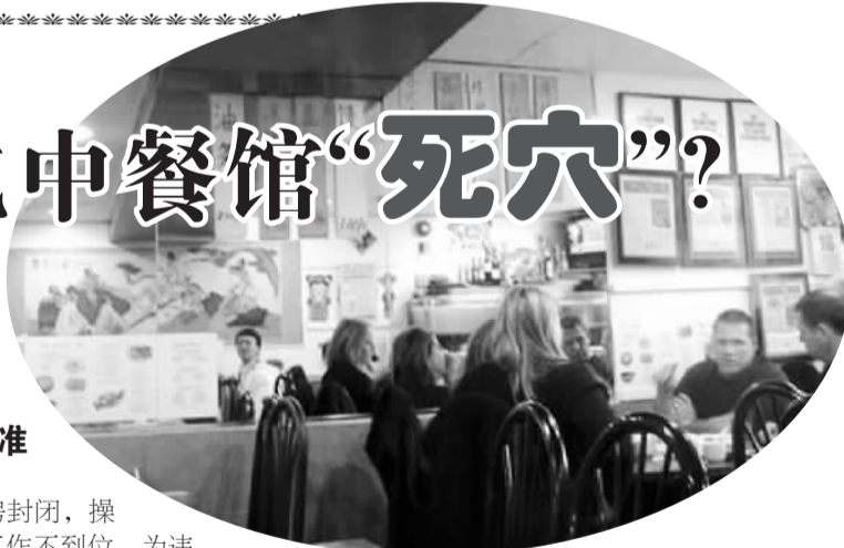
图为美国一家典型中餐馆。