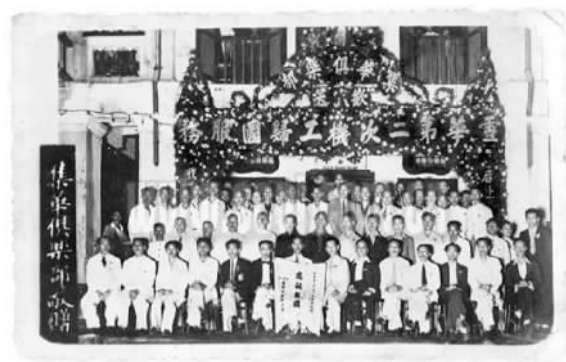
图为第二批南侨机工回国服务团集体留念照。