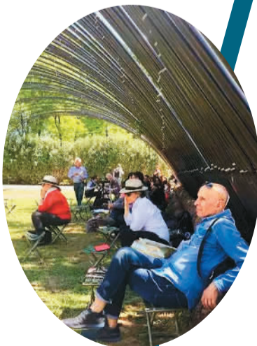
意大利艺术家表演装置作品。 游客在刘家琨作品阴凉处休息。