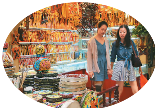
两名游客被国际大巴扎内的民族乐器所吸引。