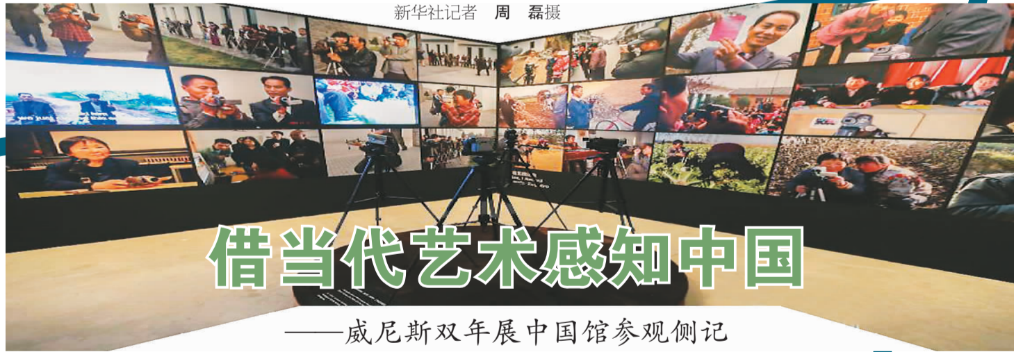
吴文光作品“村民影像计划”。