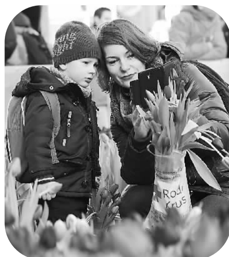
拍照。荷兰阿姆斯特丹市民在郁金香节上参观。