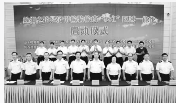
丝绸之路经济带检验检疫“9+1”区域一体化工作启动仪式