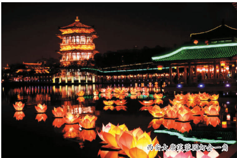
西安大唐芙蓉园灯会一角

6月18日至20日,被誉为全球旅游业最高会议的第七届联合国世界旅游组织丝绸之路旅游国际大会(下称“丝路国际大会”)在陕西省西安市举办,这是继2013年在甘肃敦煌举办第六届丝路国际大会之后,该会议再次在中国举办。本届“丝路旅游国际大会”以“丝绸之路旅游开创美好未来”为主题,同期举办的丝路旅游部长会议则聚焦“推动丝绸之路旅游市场一体化”,围绕提升旅游便利化、扩大人员交流规模、开展联合推广、加强旅游人才培养等议题展开讨论。