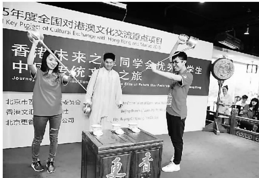
6月17日, 100多名来自香港大学、香港中文大学等香港高校的大学生, 来到北京马连道茶叶街, 通过亲身参与炒茶、观赏茶艺表演等环节, 与茶文化近距离接触。图为香港大学生跟“茶博士”学习使用长嘴壶要领。