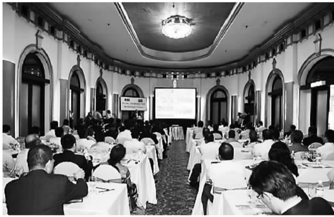
青岛市商务代表团在斯里兰卡举办商务对话会。

这样的愿景正在变为现实。日前，青岛港与中巴经济走廊南起点的瓜达尔港建立友好港关系。未来，两港将充分发挥作为中巴经贸联系窗口的作用，促进相互间的货物贸易，建设便