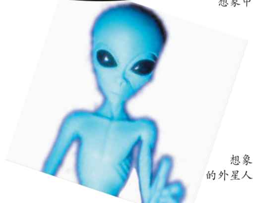
想象中的外星人图