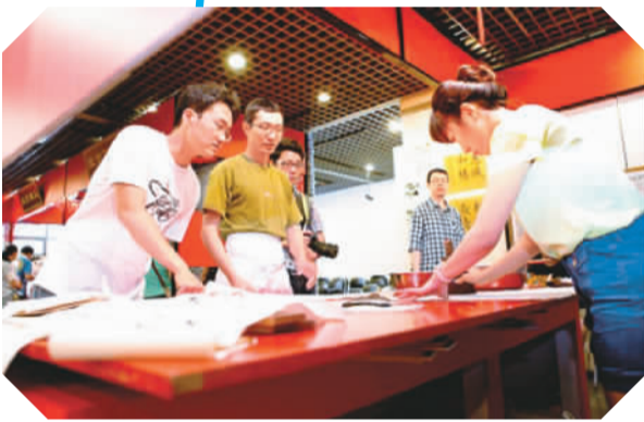
在东城区非遗博物馆,非遗传承人展示古字、古画修复技艺。

由450公斤俄罗斯碧玉雕琢而成的菊花花薰,全部由真丝制作而成的中国五大名菊之一“十丈珠帘”,充满童年回忆的“绒鸟”“绒花”,正在微缩的四合院里大办喜宴的“毛猴”……在建筑面积950平方米的博物馆展厅内,市民得以一睹平时难见的非遗珍品芳容。据介绍,非遗博物馆的展品将不定期进行更换,并免费向市民开放。