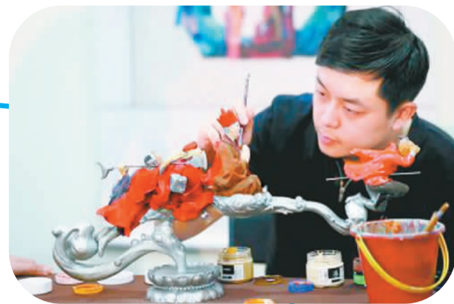
“泥人张”彩塑传人在京津冀非遗展的布展现场对参展作品进行精雕细琢。