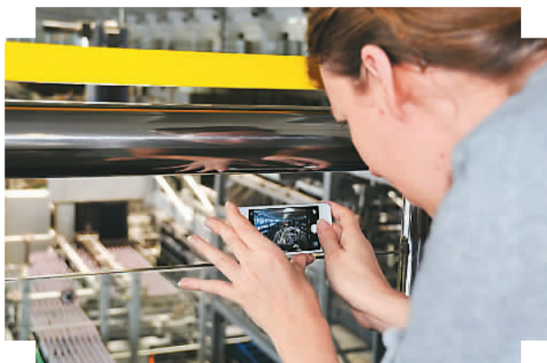
一名外国友人正在全神贯注地观察啤酒酿造过程。