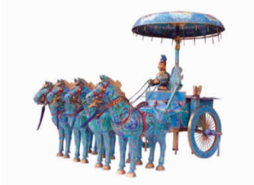
景泰蓝工艺品作品“兵马俑战车”。