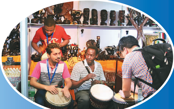
参展的客商展示非洲特色商品。