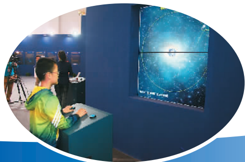
小朋友在中国探月工程展区进行体验。

说,这次活动的开展,是全国卧尔兹演讲大赛和《古兰经》诵读比赛取得成果的一次集中展示,充分反映了我国伊斯兰教界和广大穆斯林群众的主流心声,真切体现了伊斯兰教界的责任担当,表明了中国伊斯兰教界维护民族团结,维护社会稳定,反对宗教极端思想、反对暴力恐怖活动,维护祖国统一的坚定决心。