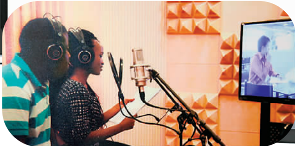
配音演员用斯瓦希里语为中国影视剧配音。

南非“中国年”正在如火如荼地进行。 辽宁芭蕾舞团与约翰内斯堡芭蕾舞团联合排演的《天鹅湖》在约翰内斯堡和布隆方丹两个城市巡演了21场,平均上座率高达81.2%,以300多万兰特的票房总收入创造了约翰内斯堡芭蕾舞团在南非的票房纪录。从单纯的交流到合作生产文化产品,正在成为中非合作的一种趋势。 尼日利亚iROKO TV副总裁塞德里克·皮埃尔-路易斯此次来华是为了寻找在内容方面的合作伙伴。作为世界最大的非洲电影数字分销商,他们希望在引进中国电影的同时能够与中国公司共同拍摄和制作。在尼日利亚,有着非洲好莱坞之称的“尼