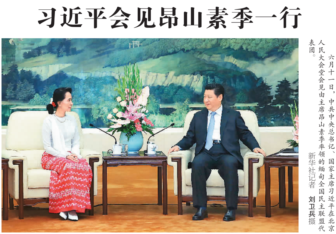
六月十一日,中共中央总书记、国家主席习近平在北京人民大会堂会见由主席昂山素季率领的缅甸全国民主联盟代表团。

据新华社北京6月11日电(记者郝亚琳)中共中央总书记、国家主席习近平11日在人民大会堂会见了由主席昂山素季率领的缅甸全国民主联盟代表团。 习近平强调,中方始终从战略高度和长远角度看待中缅关系,支持缅甸维护主权独立和领土完整,尊重缅甸自主选择发展道路,支持缅甸民族和解进程,坚定不移推进中缅传统友好和务实合作。希望并且相信,缅方在中缅关系问题上的立场也将是一贯的,无论国内形势如何变化,都将积极致力于推动中缅友好关系发展。 习近平说,中国共产党同全国民主联盟开展交往以来,两党关系取得较快发展,交流合作日益密切。希望通过这次访问,你能够更深入地了解中国和中国共产党,这有助于增进双方相互理解和信任,为两党两国关系发展打下更好基础。也希望你和全国民主联盟继续发挥建设性作用,积极引导缅甸民众,公正理性看待中国和中缅合作,为两国关系发展增添更多正能量。 昂山素季说,缅中两国是邻居,而邻居是不可选择的,致力于两国友好关系发展至关重要。缅甸全国民主联盟重视缅中友好,钦佩中国共产党领导中国取得的巨大发展成就,希望通过此访深化两党关系,推动两国人民之间的友好关系向前发展。