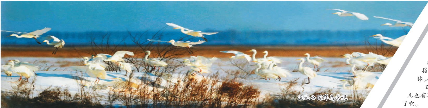
湿地公园观鸟景观

提起湿地，大家并不陌生。从沿海到内陆，从平原丘陵到高原山区，或沼泽湖泊，或河流海岸甚至是稻田，湿地以其丰富的多样性，精心呵护着人类家园。湿地与森林、海洋并称为地球三大生态系统。湿地是水陆在时间和空间坐标上的交替界面的区域，是自然界生物多样性和人类最重要的生存环境之一。如今，越来越多的人正通过旅游的方式，走近湿地、了解湿地、亲近自然、爱护生态。 我们一行来到哈尔滨呼兰河口湿地公园，放眼望去，水天相接，宛若大海。各滩岛之间由绵延2000多米的木栈桥相连，犹如一串精美的项链串起了颗颗珍珠，又似一道水上长城。这片湿地位于松花江和呼兰河交汇处，面积38.5平方公里，是目前国内最大的城市湿地。登上观鸟台，可俯瞰湿地全景，观碧草青青，灰雁、江鸥在我们身边飞翔，不时还能看到丹顶鹤、白枕鹤等国家珍稀鸟类。湿地堪称鸟类生息繁衍的天堂。 全国湿地旅游正在湿地生态系统可承受的前提下适度有序开展。国家林业局副局长陈凤学在论坛上介绍说：“目前全国已建立46个国家重要湿地，570多个湿地自然保护区和900多个湿地公园，共有2340万公顷湿地得到了有效保护。”