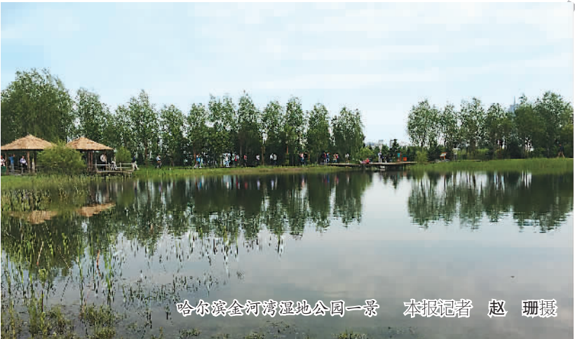
哈尔滨金河湾湿地公园一景

采访中记者了解到，在湿地保护与开发上，湿地资源大省黑龙江走在了前列。据介绍，黑龙江省是我国湿地最为丰富的省份之一，全省的天然湿地556万公顷，位居全国第三。全国46个重要湿地中，黑龙江就有8个，还有23个国家级湿地自然保护区、41个国家级湿地公园，湿地景观类型丰富而独特。 黑龙江林业厅厅长杨国亭介绍说，黑龙江省是全国第一个为了保护好湿地实现立法的省份。到目前为止，黑龙江省建立了87个湿地类型的自然保护区，其中23个国家级、64个省级，形成了全国最大的湿地保护管理网。 目前，黑龙江以湿地资源为基础，以湿地文化、民俗文化、乡村文化、时代变迁为线索，以高寒湿地的独有魅力为依托，构建了以“一带两湖三网两边”为核心的湿地旅游产品体系。“未来，黑龙江不仅是冰雪旅游目的地，还将是中国湿地生态旅游的目的地、国际湿地生态旅游的体验地。”黑龙江省旅游局局长锡东光说。