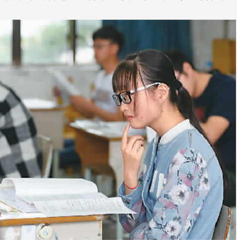
6月7日，在安徽省黄山市屯溪一中考点，考生正在考场内阅读试卷。

虽然选择不同、价值观不同、人生道路不同，但同样享有入生出彩的机会，这本身就是“中国梦”的包容性内涵之一。这一主题，在新课标二卷的命题中体现得更为充分：前沿科技工作者、基层技工和在微博上展示各地美景的摄影师，虽然人生道路不同，但都是“当代风采人物”，身上各具生