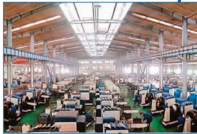
图为豪迈集团车间一角。(资料图片)

高速增长,原因何在?张恭运认为,宝塔形的股权结构和长效的股权激励机制,是豪迈的“秘密武器”之一。留住人才,就拥有未来。