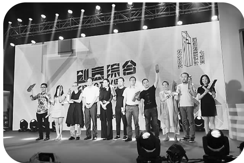
深圳七彩奖颁奖典礼现场

值得关注的是，本届七彩奖奖金总额原为400万元人民币，由于个别奖项空缺，最终也达到了350多万元人民币，深圳市委、市政府对创意设计的投入力度和重视程