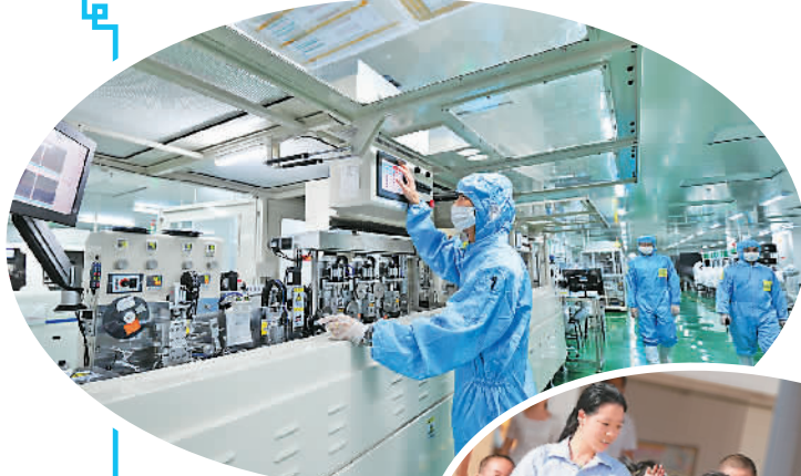
工人在赣州同兴达电子科技有限公司自动化无尘车间内生产液晶显示模组。

越来越多的投资者有这样的体会：关注赣州就是发掘宝贵商机，投资赣州就是开创美好未来。“虹吸效应”日益凸显。赣州充分利用毗邻东南沿海区位优势，《若干意见》政策优势，着力招大引强，承接产业转移。突出粤闽港台等重点区域，依托赣南承接产业转移示范区和“三南”承接加工贸易转移示范区，开展专业化、市场化、网络化和产业链招商。先后举办央企入赣、赣台会、光彩事业赣州行等重大招商活动。种好梧桐树，引得凤凰至。赣州良好的综合投资环境，吸引了51个国家和地区的客商前来投资兴业，也吸引了大批实力企业和有识之士聚焦赣州、进驻赣州。德国格特拉克传动系统公司、日本东芝、新加坡伟创力集团、富士康科技集团、中国华能等一批国际国内500强企业纷纷落户赣州。正威国际、阳光集团、横店集团、海亮集团、双胞胎集团等知名民企也都把这里作为企业发展的重要战略基地。近年来，赣州市共引进投资亿元以上企业167家，其中百亿元以上产业项目6个。2014年全市实际利用外资12.2亿美元，增长10.4%；引进省外500万元以上项目资金524.2亿元，增长15.4%。