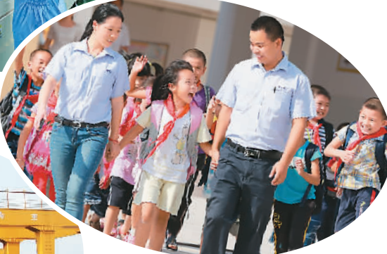
赣州经开区香港工业园小学。