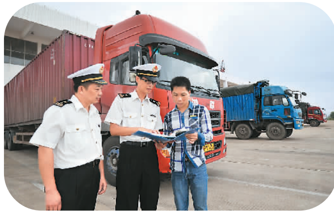
海关工作人员在赣州出口加工区为进出口货物办理通关手续。郭芷汇报

红色血脉代代相承，服务振兴矢志不渝。赣州掀起干事创业的作风革新，营造优越的“软环境”为振兴发展护航。近年来，赣州全力弘扬苏区精神，扎实践行群众路线，深化“送政策、送温暖、送服务”工作，实现干部直接联系服务人民群众“双向全覆盖”。持续开展干部作风“治庸、治懒、治散”，严厉整治部分干部不作为、乱作为、慢作为现象。通过设立投诉电话、媒体公开征集、明察暗访等多种渠道，查摆“庸、懒、散”等方面问题，切实提振干部精气神。